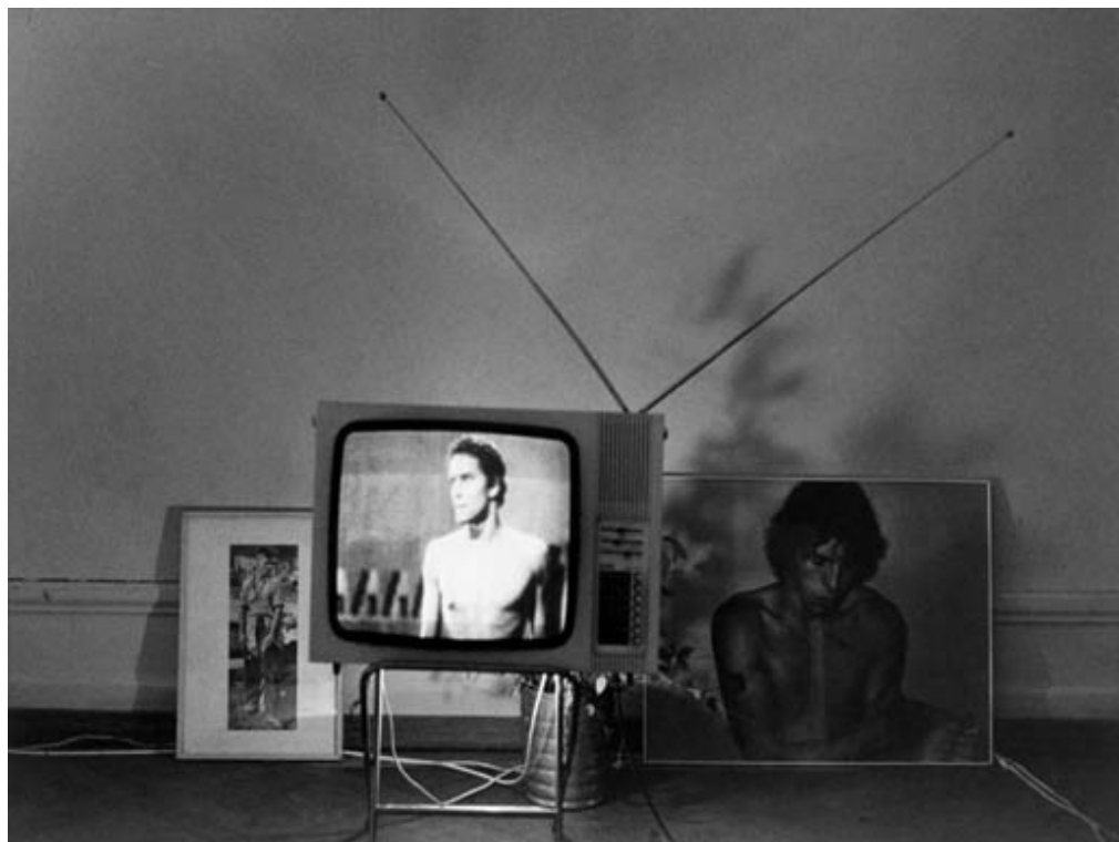
Bild: Walter Pfeiffer, Untitled, 1976, de la série "Proposal für eine Ausstellung", collection Fotomuseum Winterthur © Walter Pfeiffer

N° de thème: 840.6 N° d'abonnement: 1090991